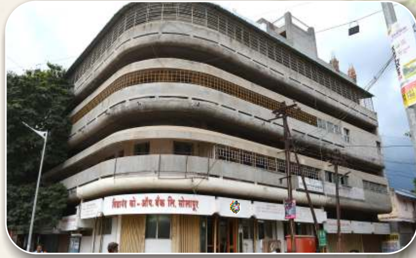
मुख्य शाखा, बाळीवेस