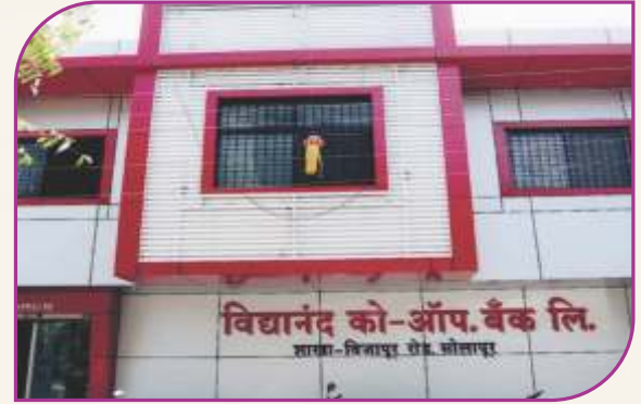
विजापूर रोड सोलापूर शाखा